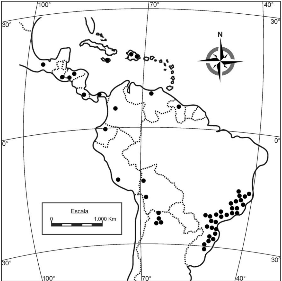
Fig. 2. Mapa de distribución de Asplenium harpeodes en el Neotrópico.

gentina, en las provincias de Jujuy y Salta (Fig. 2). Esta especie crece en el sotobosque montano de las Yungas, a la orilla de cursos de agua, a partir de los 1000 m s.m., formando poblaciones no muy numerosas y con ejemplares distanciados entre sí.