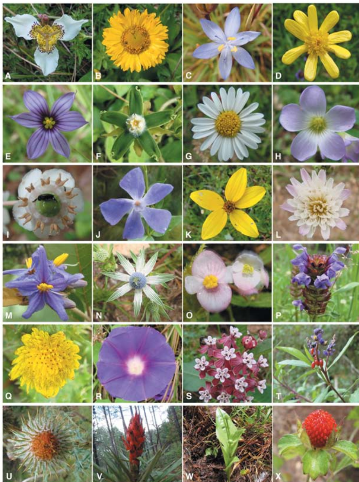
Figura 3. Representantes de la flora de la comunidad de Bazom. A) Tigridia chiapensis (endémica), B) Helenium scorzoneraefolium , C) Commelina diffusa , D) Ranunculus petiolaris , E) Sisyrinchium scabrum , F) Gonolobus stenosepalus , G) Symphyotrichum moranense , H) Oxalis alpina , I) Chimaphila maculata , J) Vinca major , K) Bidens triplinervia , L) Trifolium repens , M) Solanum lanceolatum , N) Eryngium scaposum , O) Begonia oaxacana , P) Prunella vulgaris , Q) Sonchus asper , R) Ipomoea purpurea . S) Asclepias similis , T) Monina xalapensis , U) Cirsium subcoriaceum , V) Tillandsia ponderosa , W) Malaxis brachyrrhynchos , X) Fragaria vesca .