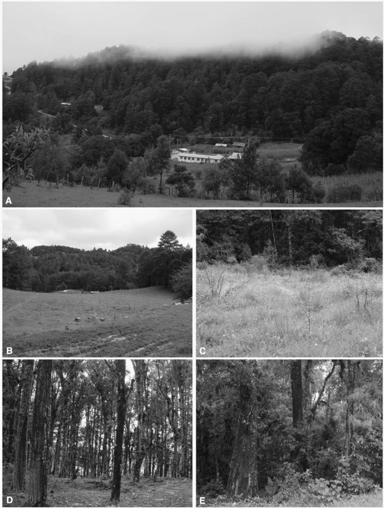
Figura 2. Tipos de vegetación de la comunidad de Bazom. A) bosque de pino-encino, B) campo abandonado, C) pastizal, D) bosque temprano, E) bosque maduro.